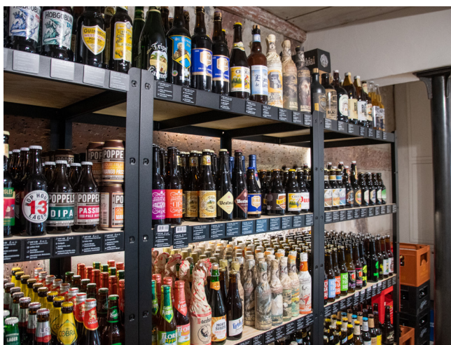
Bierspezialitäten im Mini.Bierladen