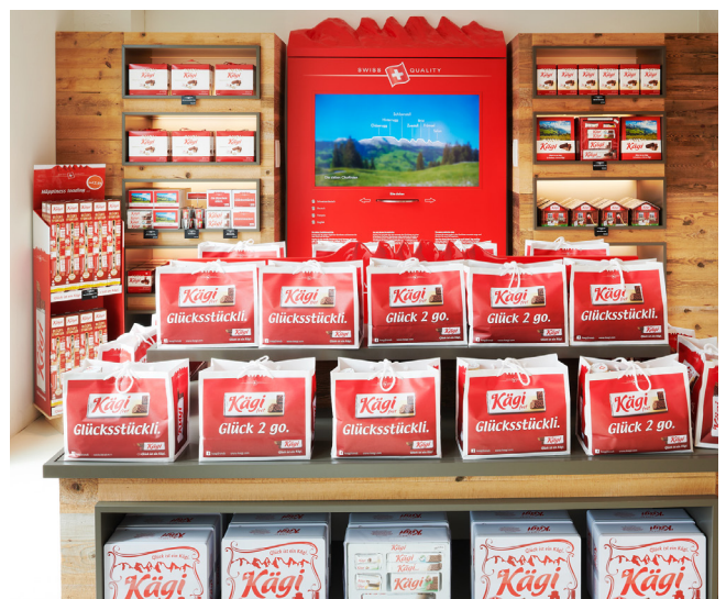
Auswahl an Kägi-Spezialitäten im hauseigenen Fabrikladen.