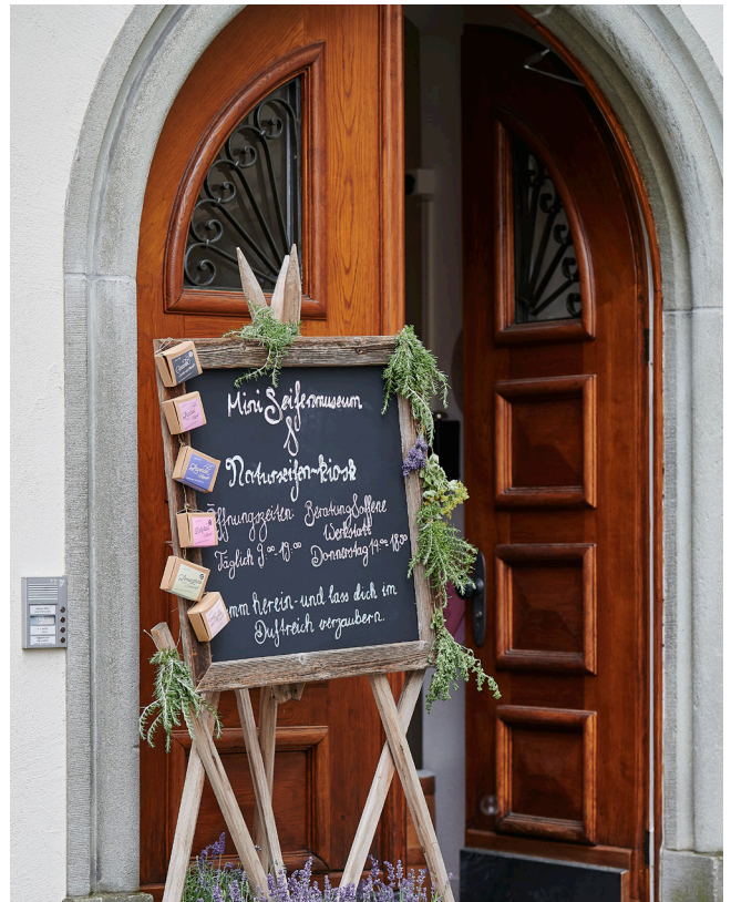
Eingang Toggenburger Seifenmanufaktur