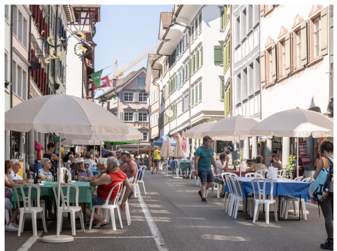
«bunte Tische» der Wilden Weiber Lichtensteig in der dafür autofreien Hauptgasse zwischen den Laubengängen